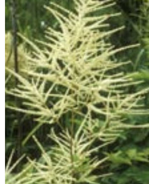
Favorieten van Luc Crataegus monogyna • Acer griseum • Aruncus dioicus